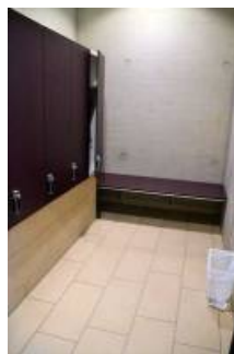
Umkleide und Duschen Wasserwelt