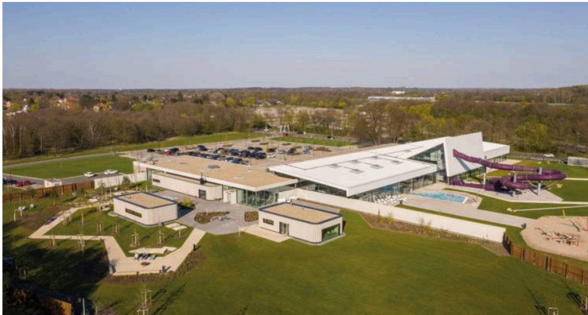
Wasserwelt Langenhagen