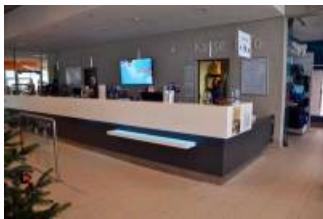
Kasse / Ticketschalter