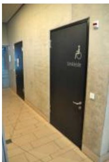
Umkleide und Duschen Wasserwelt